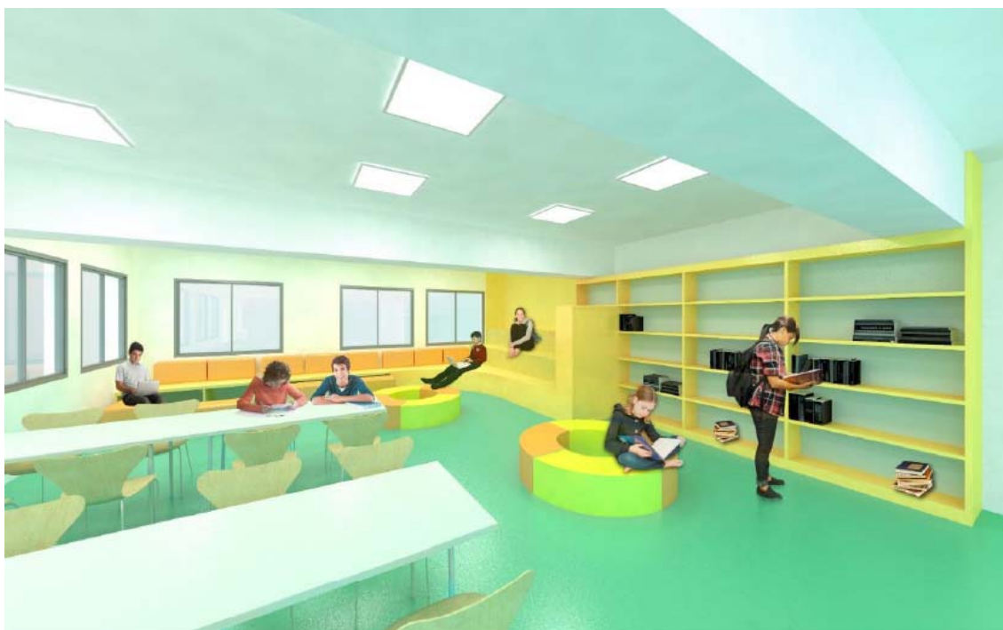
Proposta inicial de disseny de la mediateca

En ser un espai més gran, es possibilita l'ocupació per un nombre d'alumnes superior en cas necessari i al mateix temps es manté la possibilitat de fer convocatòries per a reunions i altres actes més massius. A futur (no previst en l'actuació inicial) es podria instal·lar un envà mòbil que possibilités la divisió i l'aïllament dels dos espais: mediateca i sala de reunions, així com uns accessos independents als dos espais.